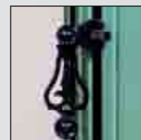
Espagnolette en Aluminium