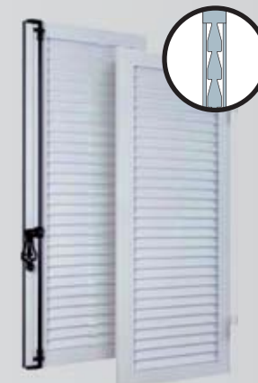
Lames jointives extrudées - Non isolé