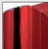
Structure en Aluminium isolé, épaisseur 27 mm R=0,28