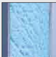
Battement + Joint