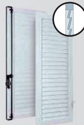
Lames Américaines extrudées - Non isolé