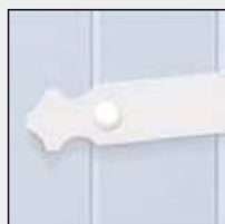
Penture en Aluminium blanc à bout festonné