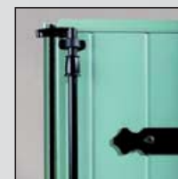
Joint sur battement et pentures Aluminium à bouts festonnés